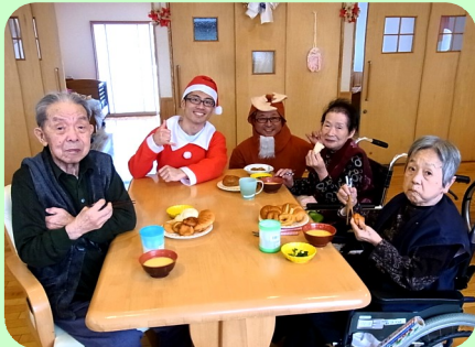
12月24日 クリスマス会食