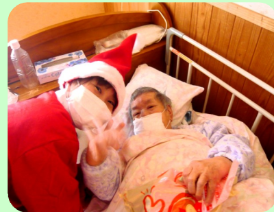
12月25日 ユニットクリスマス