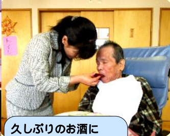
久しぶりのお酒に ほっぺがホンノリと...