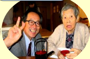
あの景品とったぞー!