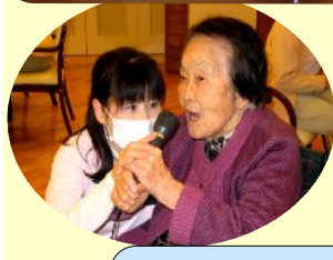
カラオケ・ワクワク体操 イチ・ニー イチ・ニー !!