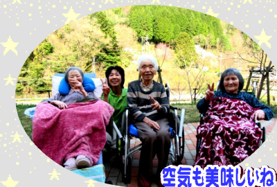
空気も美味しいね