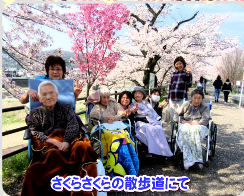
さくらさくらの散歩道にて