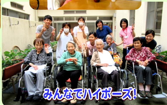
みんなでハイポーズ!