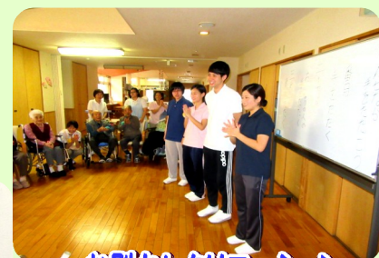
お別れレクリエーション