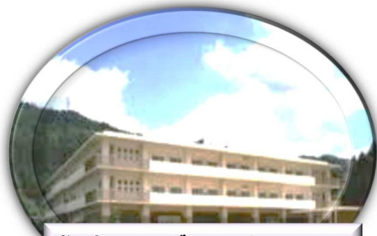
拠点 みずなみ瀬戸の里