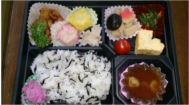
平成 26年 2月 21日