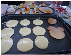
* 3月行事 * 「手作りパンケーキ」