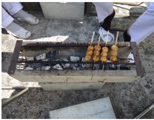
* 10月行事 * 「手作り五平餅」