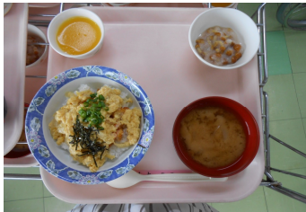
* 開園記念日 * 「えびカツ丼」